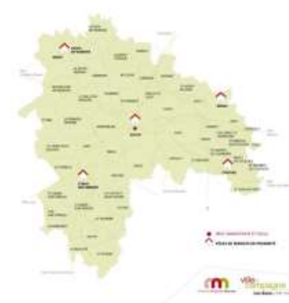
Exemples dans 2 PAT de Bourgogne-Franche-Comté