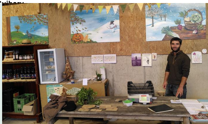
Figure 3 : Les locaux de l'AMAP de Mayenne, à la ferme de Pierre

Le programme pédagogique s'appuiera notamment sur l'AMAP de Mayenne, qui accueille déjà des groupes scolaires. L'objectif est la création d'un groupe sur la sensibilisation des enfants, notamment avec des enseignants du territoire. Les locaux de l'AMAP sont en cours d'aménagement afin d'accueillir des actions de ce programme.