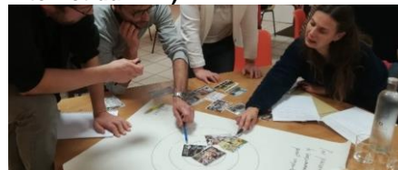
Figure 2 : Illustration d'un temps de co-construction du PAT

Les réunions étaient plutôt participatives et c'est important. C'est bien d'avoir les différents interlocuteurs autour de