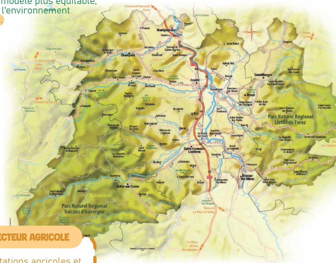
Figure 2. Carte de l'Agglomération Pays d'Issoire