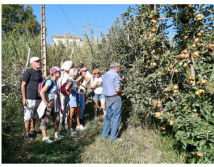
Merci à l'agriculteur meynois !