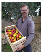
Merci à l'agriculteur théziérois !